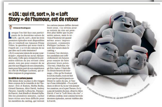
Daté du 01/04 (teasing page 15)