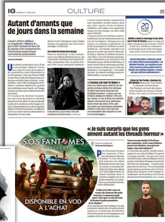
Daté du 01/04 (page 16)