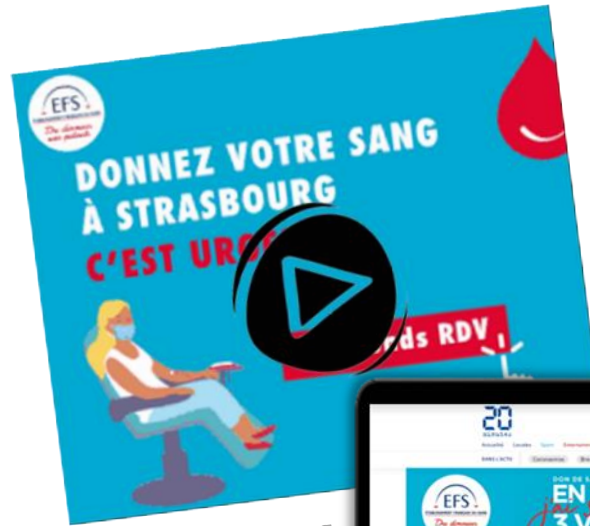
GIF Vague Strasbourg