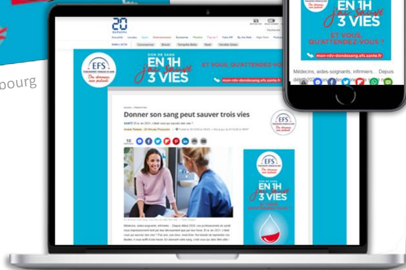
Home page + habillage + grand angle (déc 2020)