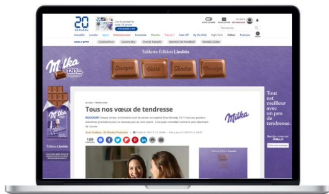
Article DigitalOne avec Habillage + Grand angle