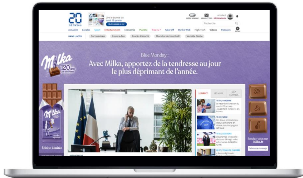
Home Page avec Habillage