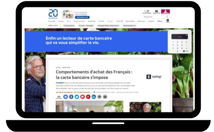
Habillage + grand angle