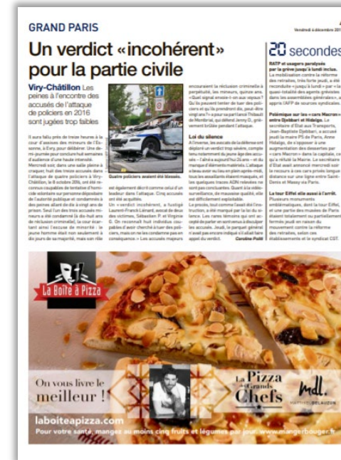
2 demi-pages sur Paris