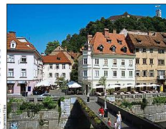
La Slovénie, havre de paix loin des tumultes du foot, est entourée de forêts.

comme faire du vélo sur la piste cyclable en pierres lumineuses qui relie Nuuen à Eindhoven. « Il y a aussi la parade Bosch, qui fait hommage au peintre Jérôme Bosch, pendant laquelle des constructions complètement psychédéliques défilent sur l'eau. »